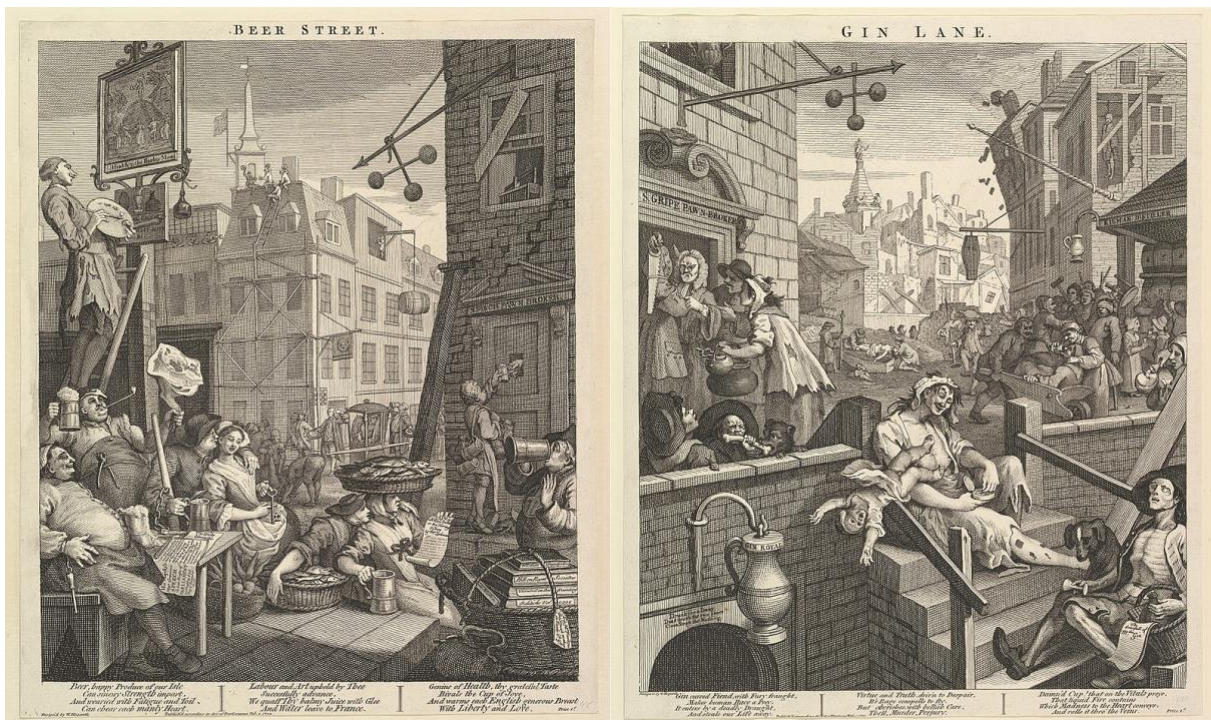
William Hogarth - Beer Street and Gin Lane 1751