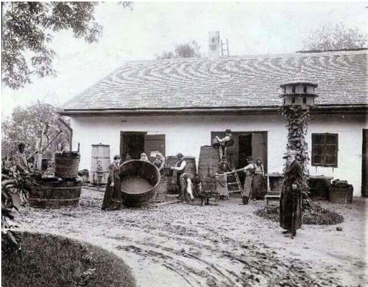
Jókai svábhegyi kertjében (II. Költő u. 21.) szüret idején. 1910.