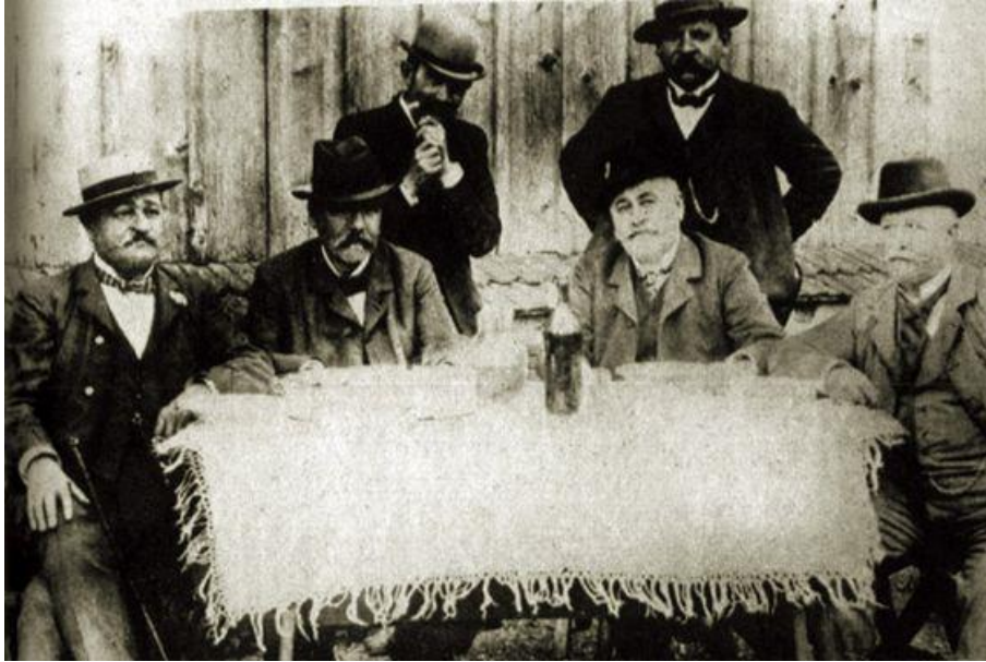
Gárdonyi Géza Baráti körben A ritka fotón, a feltételezések szerint: Gárdonyi Géza és Móricz Zsigmond a két álló alak. Majd balról jobbra Bródy Sándor, Mikszáth Kálmán, Szabolcska Mihály és Jókai Mór láthatók.