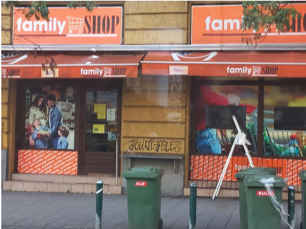
(Graffiti a Bartók Béla út 2. alatt.)

Kezdetben a téma talált meg engem és az egészel azért kezdtem foglalkozni, mert a szokásos útvonalon, amin haza járok, észrevettem egy graffitit.