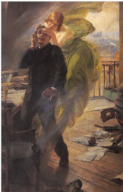
Albert Maignan - La muse verte